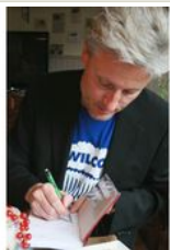
Buchtipp: Unschuldsvermutung – eine Polit-Satire von Florian Scheuba, im Amalthea-Verlag erschienen.

Im Schutzhaus biegt sich der Frühstückstisch. Körbe voll mit Gebäck-Variationen, Kuchen, Kolatschen, eine Schinken-Käse-Platte, appetitlich angerichtete Joghurt-Gläser mit Nüssen und Ham and Eggs im Pfandl. Der Kabarettist bestellt Kaffee dazu - "bitte schwarz, groß, kurz".