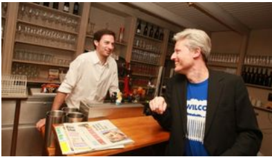
Der Wein-Fan an der Schank vom Schutzhaus am Schafberg.

"dass ich mir alles aussuchen kann, ist ein Spaßfaktor. Da kann ich mich immer wieder neu erfinden und in mich selbst hineinhorchen, was juckt mich jetzt". Ihm taugt es, "wenn Sachen erfolgreich sind, die nicht total vorhersehbar sind und nicht nach einem bestimmten Schema gestrickt sind".